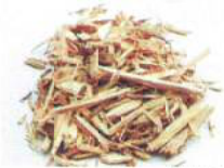
ロストル交換で粒度調整可能。

生産された良質のおがこは 牧場でしきわらとして利用 (良い堆肥ができると好評です)