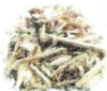
ロストル交換で粒度調整可能